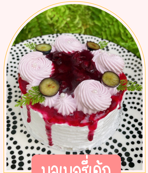
บลูเบอรี่เค้ก