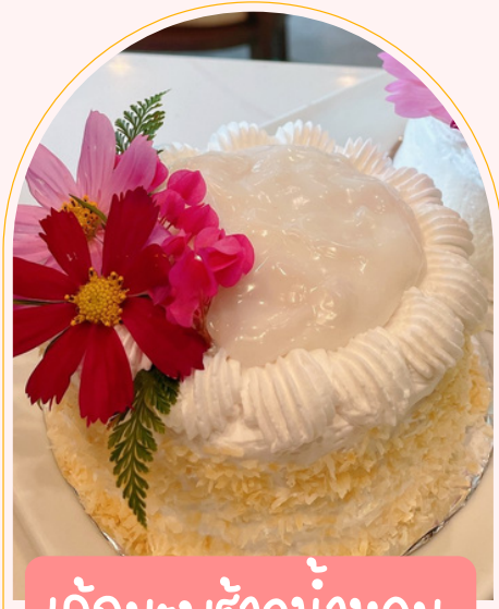
เค้กมะพร้าวอ่อน