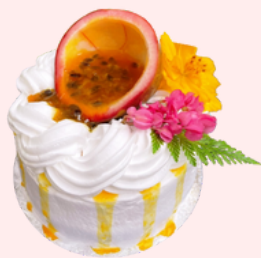
Super Passion Fruit Cake