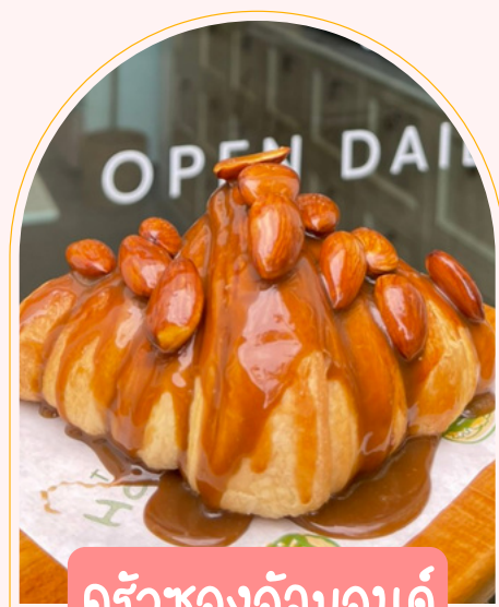
ครัวซองอัลมอนด์