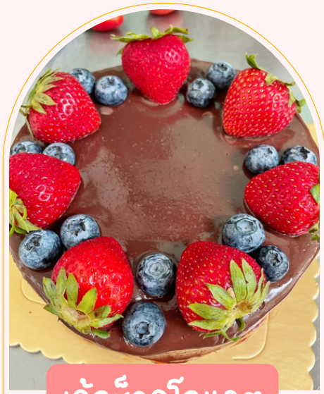
เค้กช็อคโกแลต