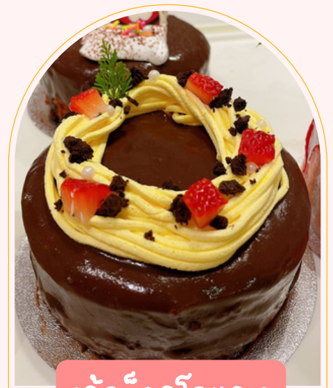
เค้กช็อคโกแลต