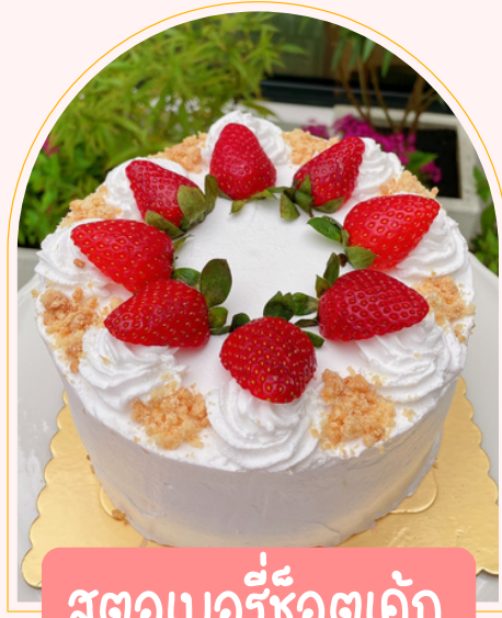
สตอเบอรี่ช็อตเค้ก