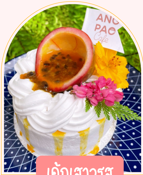
เค้กเสาวรส